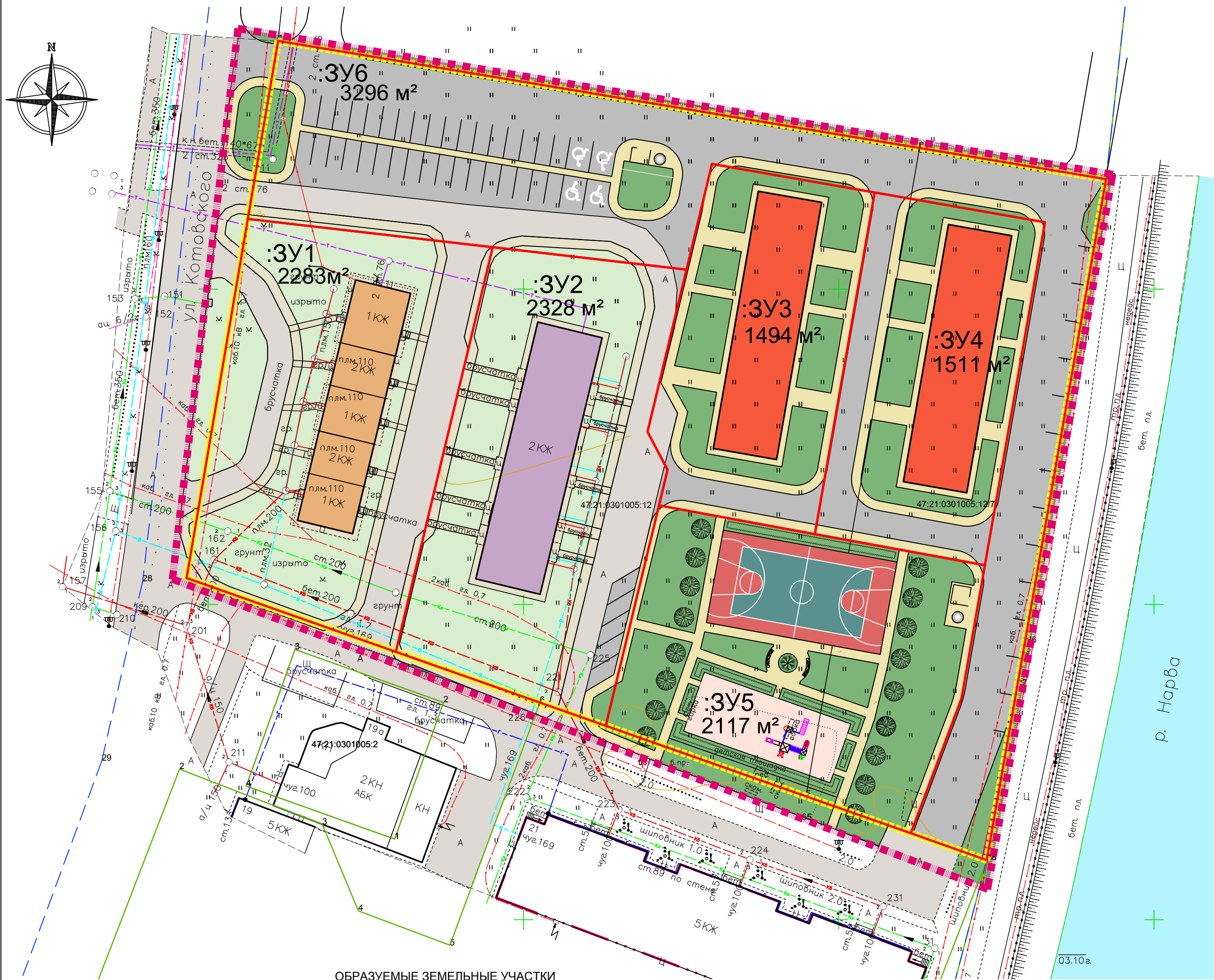
ОБРАЗУЕМЫЕ ЗЕМЕЛЬНЫЕ УЧАСТКИ