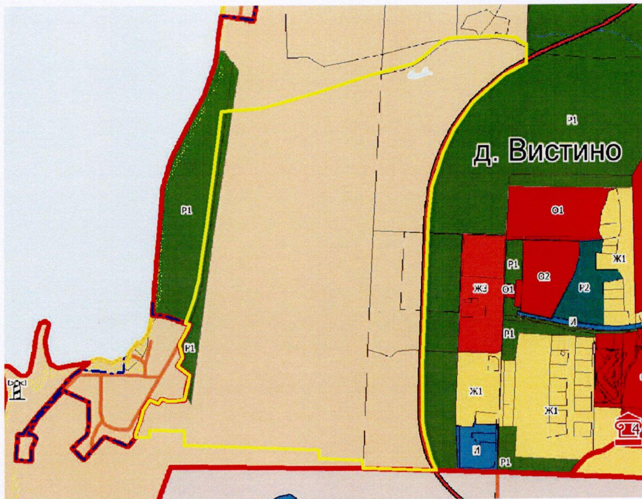
Схема границ территории проектирования

— граница территории, применительно к которой осуществляется подготовка документации по планировке территории