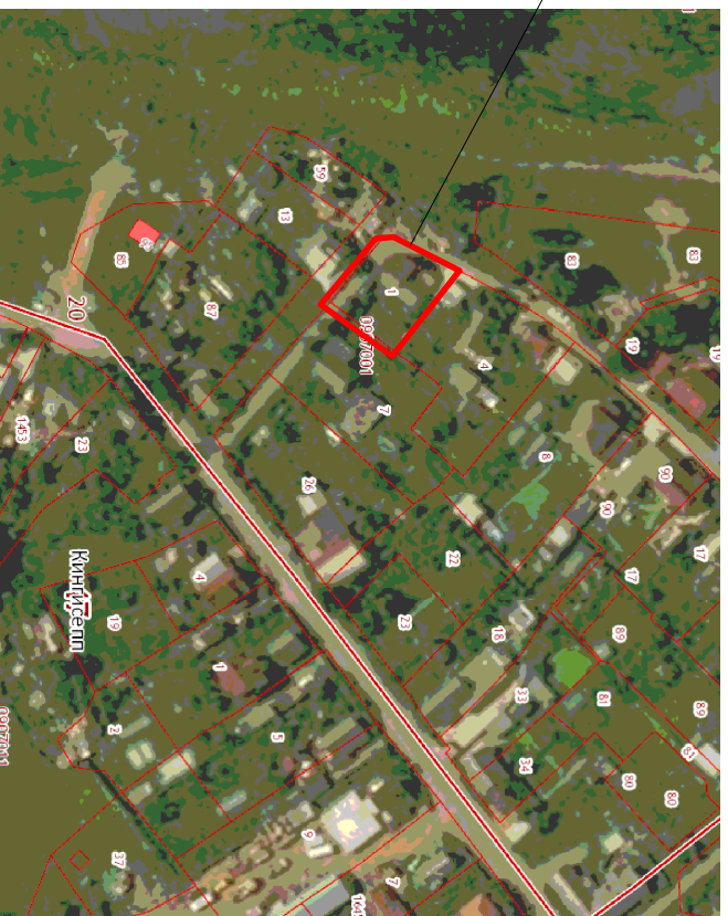
Ситуационная схема. М 1:2000